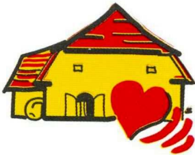
Die Fahne zum 125. Jubiläum

Die Feuerbacher Veranstaltungsszene hatte mit Brackefest, Vitamintreff, Baumpflanzungen, weiteren 20 Veranstaltungen und nicht zuletzt dem dreitägigen Kelterfest durch den WOGV an besonde-