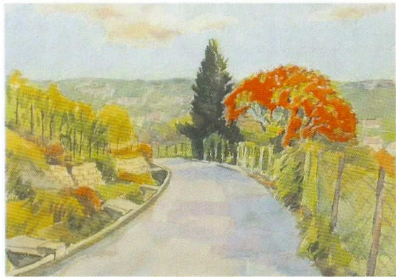
IM LEMBERG, Titelbild zu 125 Jahre WOGV, von Horst Bulling. Die Festschrift erscheint im Herbst.

Der Verein änderte seine Form mehrfach bis er dann ab dem 5. Juni 1921 seinen heutigen Namen bekam. Interessant dabei ist, dass in jedem vorausgegangenen Vereinsnamen immer der Weinbau an vorderster Stelle stand. Das Mitgliederverzeichnis im ersten Jubiläumsbuch liest sich wie eine Genealogie Feuerbacher Geschlechter, der „Grondechten“, wie sie sich gerne nannten.